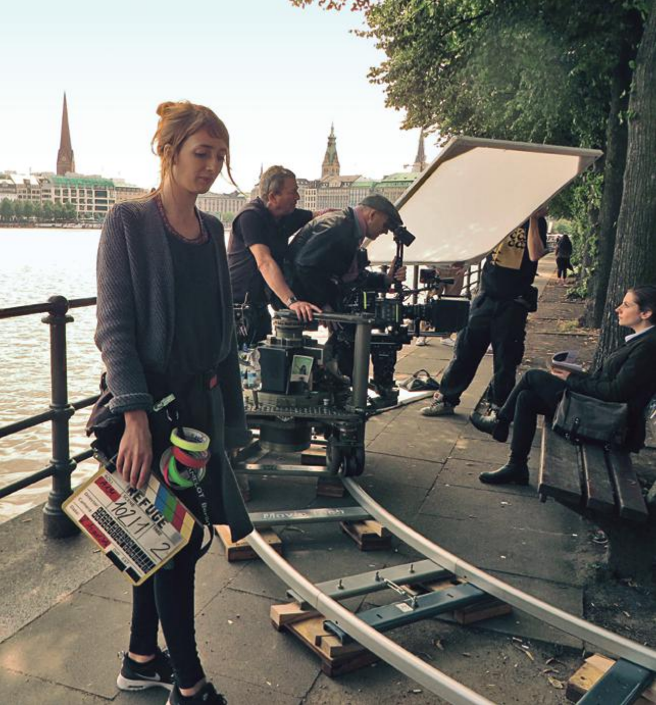
Internationaler Spionage- thriller vor Hamburg-Kulisse: Refuge von Eran Riklis. Eran Riklis seeks and finds location for his film Refuge .